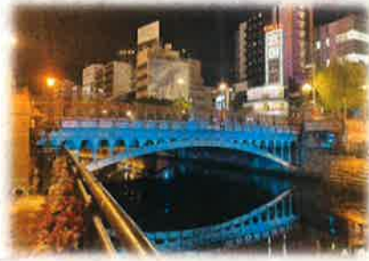
納屋橋もミズベブルーにライトアップ!