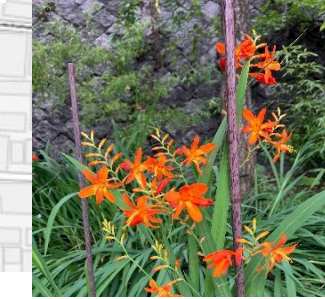
ヒオウギズイセン