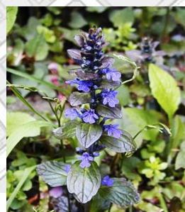
セイヨウジュニヒトエ