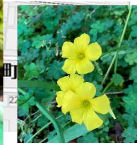
オオキバナカタバミ