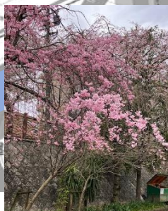
ヤエベニシダレ桜