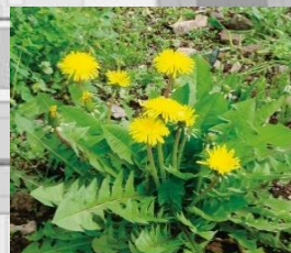
セイヨウタンポポ