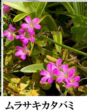
ムラサキカタバミ