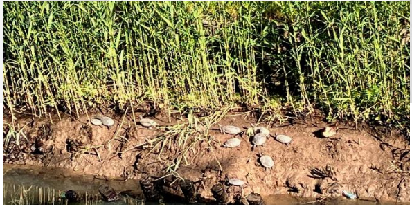
天気の良い小潮のころは亀の甲羅干しの場所です